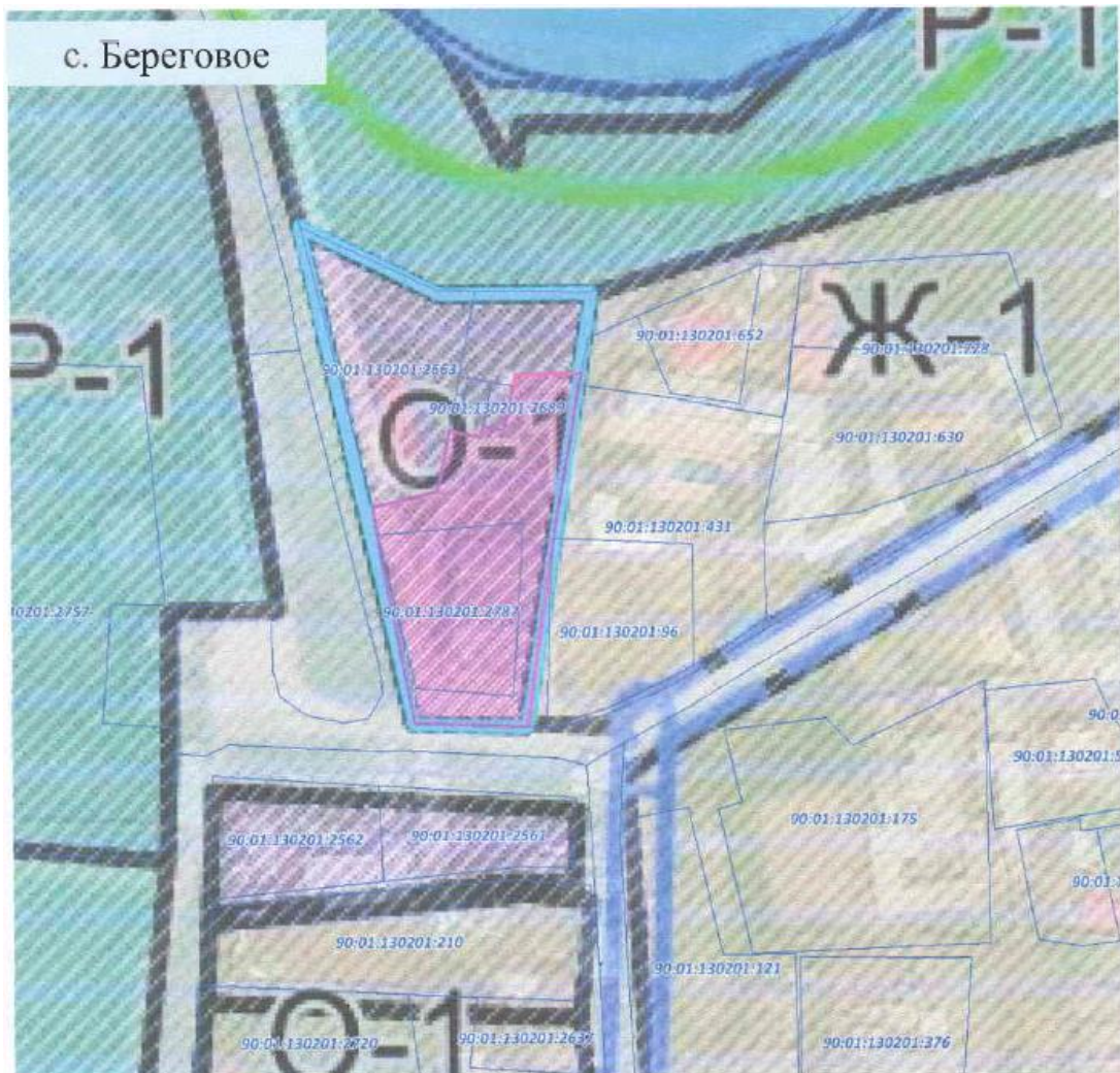
Схема границ территории подготовки документации по планировке территории