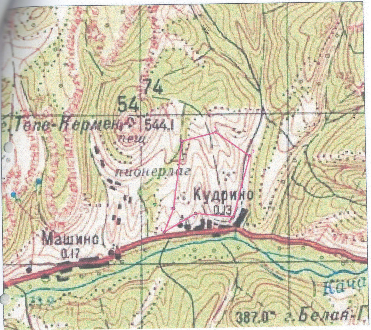
Каталог координат ГСК-2011 ГОСТ 32453-2017